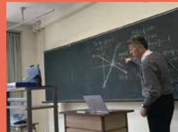
【写真左2枚】録画用のパソコンに向かって授業を行います。それを配信し、生徒は自宅で視聴し、指定された課題に取り組みました。

また連絡はインターネット上の「Google Classroom」で行い、健康状態や学習時間なども毎日記録していました。学校に登校できない不自由な時期が続きましたが、生徒の学びを少しでも前に進めるため、またこのような社会に飛び出していく生徒達に、新しい時代を生き抜く力を育てるチャンスともとらえ、今後も活用を推進していきます。